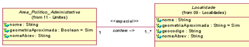
Figura 2 - Relacionamento espacial

Neste exemplo, uma área político administrativa contém uma ou mais localidades. Observe que este relacionamento é espacial, ou seja, através de uma operação espacial é possível saber quais localidades pertencem a determinada área político administrativa. Assim, no banco de dados não seria necessário criar relacionamento entre as tabelas.