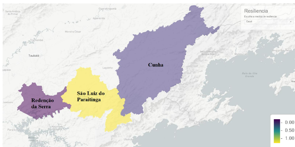
Figura 2 - Plataforma de visualização interativa do indicador de resiliência comunitária

A plataforma de visualização dos resultados é apresentada na Figura 2.